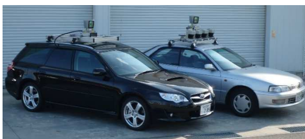
図1 歴代の自動運転車両

著者らの研究室では、これまで図1に示すようにトヨタ自動車社製ビスタ、富士重工業社製レガシー等の自動運転車両を用いて数多くの自動運転に関する研究を行ってきた。特に1998年に最初に導入した試験車両(ビスタ)では、車両の改造や制御系の設計などを含めて多くの研究室所属学生の努力により構築した。2008年に導入した試験車両(レガシー)では、システムの信頼性等を勘案し外部メーカーへ改造を委託したが、その改造ノウハウは最初の試験車両構築時の著者や学生のアイデアが基礎となっている。