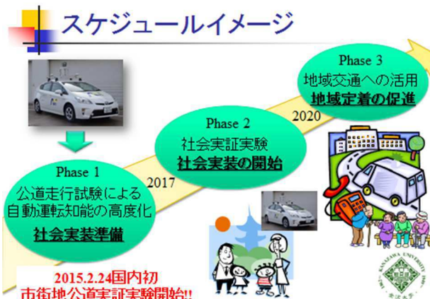
図4 実証実験のスケジュール

実証実験開始当初に走行していたルートは、信号機や交差点の右左折等を含む市街地や、アップダウンの多い山間部など様々な交通環境が存在する珠洲市内の全長約6.6kmの区間であり、一般の自動車、バイクや歩行者・自転車等も存在している通常の一般道路となっている(図3)。なお、2015年10月27日以降はほぼ珠洲市の全域での走行を開始している。この総延長は約60kmに至り、国内で類例のない規模での自動運転自動車の公道走行実証実験を実施中である。