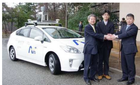
(a) 左から順に珠洲市長、著者、金沢大学学長

図4に示すように、実証実験は2015年から2017年頃を目途に自動運転の知能を高度化させる予定としている(フェーズ1)。その後2020年頃までを目途として、走行ルート、時間帯等を限定した上での地域内の交通手段としての活用方法について実証実験を通して検討する(フェーズ2)。この中では、例えば交通工学・経済学的な視点も取り入れ、自動運転自動車の適切な配置方法、運用方法等についても検討し、社会的受容性についての検討を行う予定としている。そして2020年以降は、走行ルート、時間帯といった制限事項の緩和を行い、運用を行う予定としている(フェーズ3)。