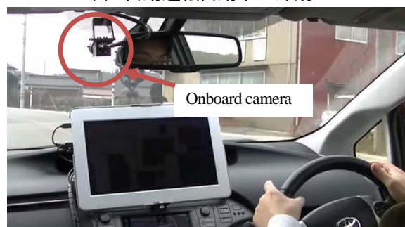
(b) 自動運転自動車の車内