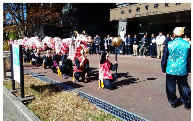
図2. 長崎大学龍踊部による龍踊りの様子