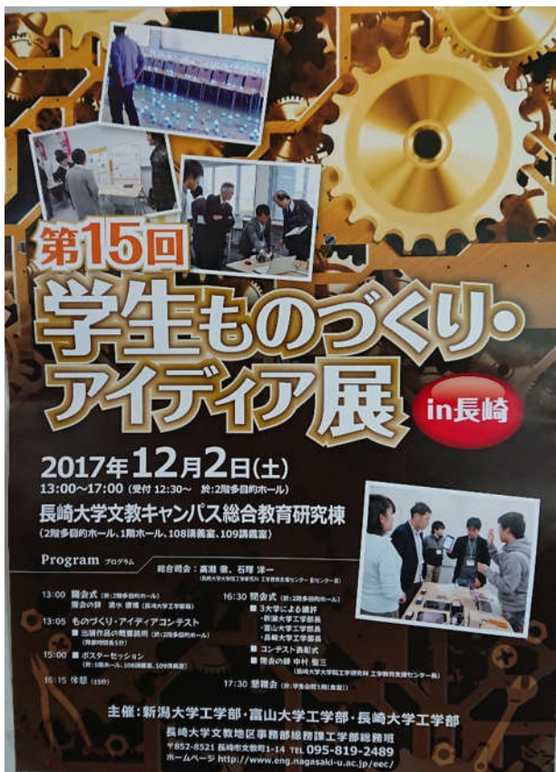
図1. 学生ものづくり・アイデア展のポスター

また、学生ものづくり・アイデア展の開会に先んじて、長崎大学全学龍踊部による龍踊り(じゃおどり)が総合教育研究棟前広場で披露された。図2はまさにこれから演じていただく様子である。先頭の玉を龍が追いかけて(玉追い)、とぐろを巻いた龍が自分の体に隠れた玉を胴の下をくぐって探す(ずぐら)の繰り返しになるようである。また、途中で龍がいなくなるので、「モッテコイ、モテコイ」という掛け声を皆で掛けて龍を呼び戻すことが慣例で、声が小さいと何度も発声させられた。アンコールの意であるとか戻ってこいこの意であるとか諸説あるとのこと。龍踊りは、演じていただいた学生の説明によると、元々は中国の雨乞いの儀式でそれが長崎へ伝わり長崎で親しまれるようになり、現在では祭りごとで行われているとのことである。龍踊りの歴史は「 http://www4.cncm.ne.jp/~zya/kiso.html 」に詳解されている。